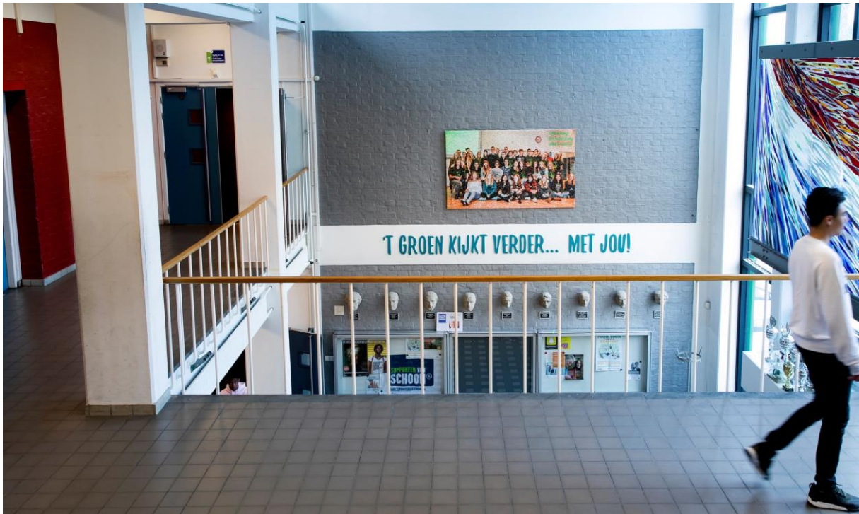
Het Groen van Prinstererlyceum.

basisschool blijven. Nu, als ik gestresst ben over school, is meestal een van mijn vrienden goed in dat onderwerp, dus ik bel ze en zij helpen. Het kalmeert me. "